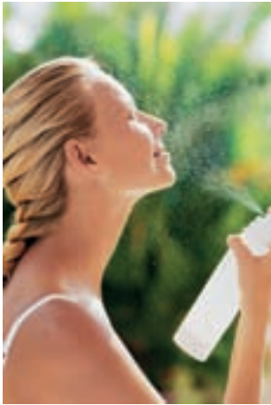
Frischekick für die Haut

In den USA ist man bereits dabei, die Leistung der neuen Ingredienz Aminoguanidine zu maximieren, indem man sie in Form eines Sprays oder Dunstes konzipiert.